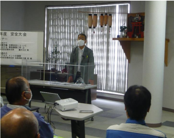
安全作業に向けて