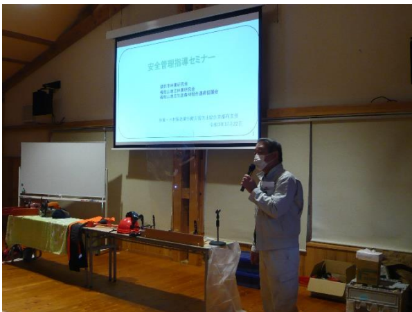
林業労働災害の状況