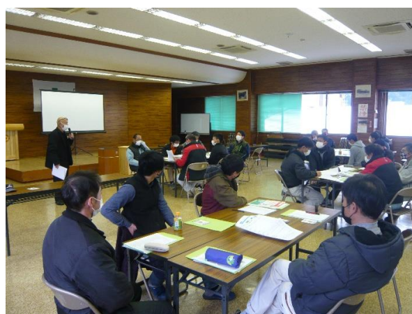
班別リスクアセスメント演習