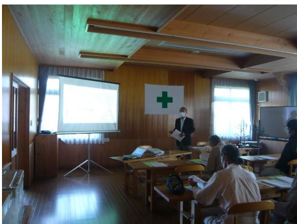
労働災害の発生状況