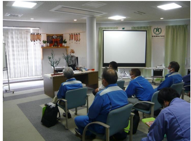
安全管理の進め方