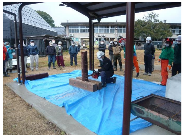
チェーンソーの点検、整備、伐木の方法