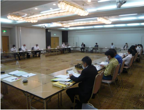
安全管理推進会議