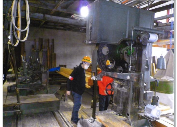
製材工場安全管理パトロール